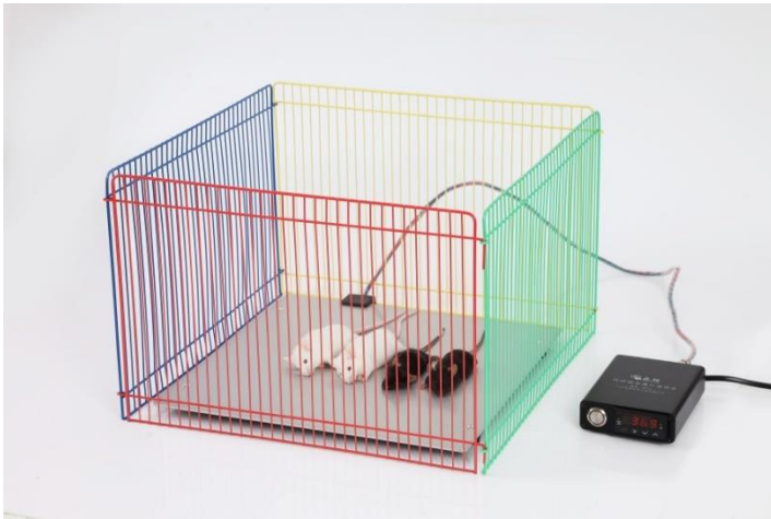
附图 2 实验动物保温热台